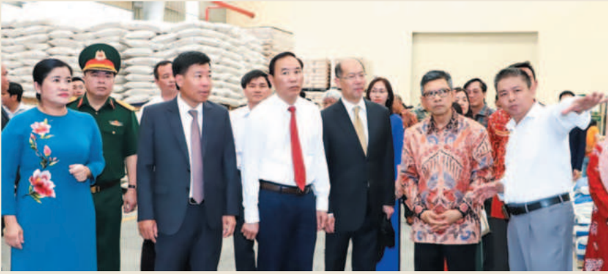
Lãnh đạo các bộ, ngành và tỉnh Bình Phước thăm và làm việc tại doanh nghiệp trên địa bàn tỉnh

năm 2050 là cơ sở để thu hút đầu tư nước ngoài vào các dự án trọng điểm và những lĩnh vực có lợi thế cạnh tranh vượt trội.