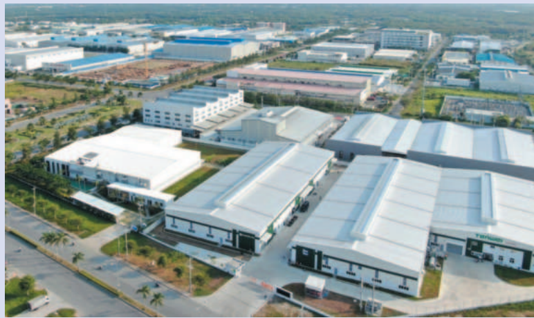
Becamex Binh Phuoc Industrial Park, Chon Thanh district, Binh Phuoc province

In particular, FDI investors in Binh Phuoc include the world's leading brands such as C.P Group of Thailand, Hayat Holding of Turkey, Sung Ju - Samsung, Japfa and Haohua Tire of China. Notably, the province is home to very big projects. CPV FOOD Co., Ltd invested US$110 million to build a meat processing and preservation project with an annual capacity of 170,400 tons in Becamex - Binh Phuoc Industrial Park. Haohua (Vietnam) Co., Ltd invested US$500 million in a tire