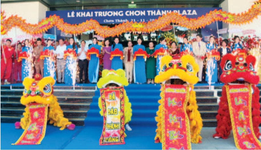
Khánh thành Trung tâm thương mại Chợn Thành Plaza, tháng 11/2023 (thuộc Dự án Khu Thương mại Chợn Thành)

cơ cấu kinh tế. Kết cấu hạ tầng tuy đã được đầu tư nhưng còn nhiều khó khăn, chưa đáp ứng nhu cầu phát triển. Tuy nhiên đến nay, sau hơn 20 năm xây dựng và phát triển, Chợn Thành đã chuyển mình mạnh mẽ, thay đổi toàn diện, trở thành trọng điểm về phát triển công nghiệp, đô thị của tỉnh Bình Phước nói riêng và vùng kinh tế Đông Nam bộ nói chung.