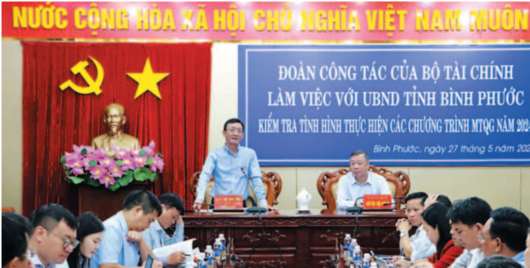
Đoàn công tác Bộ Tài chính làm việc với UBND tỉnh Bình Phước, ngày 27/5/2024

UBND tỉnh chỉ đạo Cục Thuế rà soát các khoản thu trên địa bàn trên cơ sở dự báo nguồn thu, xác định khả năng thu và khả năng cân đối thu - chi trên địa bàn năm 2024 để đảm bảo các dự toán chi thiết yếu, đặc biệt phục vụ an sinh, cải cách tiền lương.