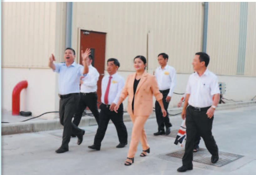
The province's authorities are dedicated to supporting businesses by fostering an open and transparent investment environment