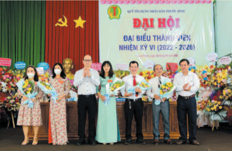
Đại hội Đại biểu thành viên nhiệm kỳ VI (2022 - 2026) của Quỹ tín dụng nhân dân Phước Bình

Đ ược thành lập ngày 20/09/1997, trải qua gần ba thập niên xây dựng và phát triển, bằng tâm nhin, chiến lược kinh doanh đúng đắn, sáng tạo, Quỹ TDND Phước Bình đã vượt qua những khó khăn, thách thức, tạo được vị thế cũng như lòng tin đối với thành viên và khách hàng. Quy mô của Quỹ ngày càng mở rộng, các chỉ số tăng trưởng vượt bậc. Tổng nguồn vốn tính tại thời điểm ngày 30/06/2024 là 288.401.345.000 đồng; số thành viên hiện nay là 2.439 thành viên; vốn điều lệ 9.484.450.000 đồng; vốn huy động 234.843.680.000 đồng; dư nợ 189.489.574.000 đồng. Tỷ lệ an toàn vốn tối thiểu của Quỹ luôn đạt trên mức tối thiểu quy định, không có khách hàng, nhóm khách hàng vay vượt hạn mức cho vay. Tại thời điểm kết thúc năm tài chính 2023, Quỹ TDND Phước Bình không còn nợ xấu.