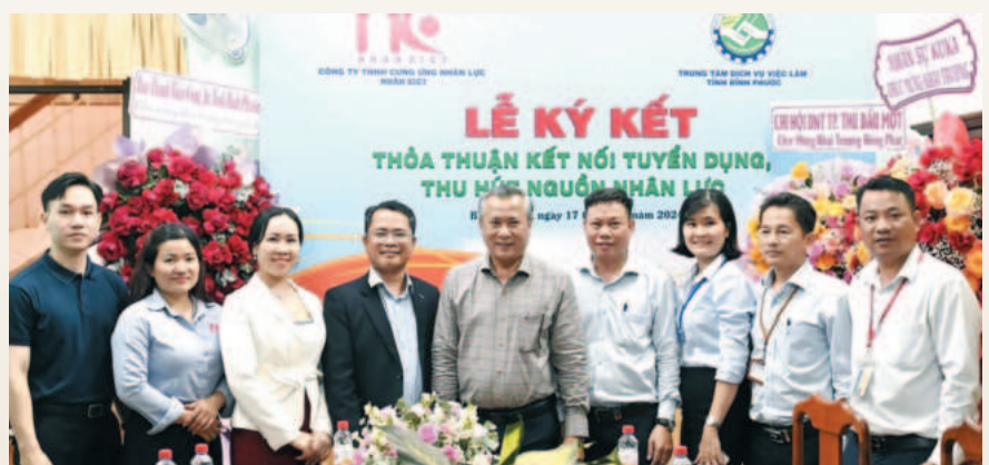
Trung tâm Dịch vụ việc làm tỉnh Bình Phước ký kết thỏa thuận kết nối tuyển dụng, thu hút nguồn nhân lực với Công ty TNHH cung ứng nhân lực Nhân Kiệt