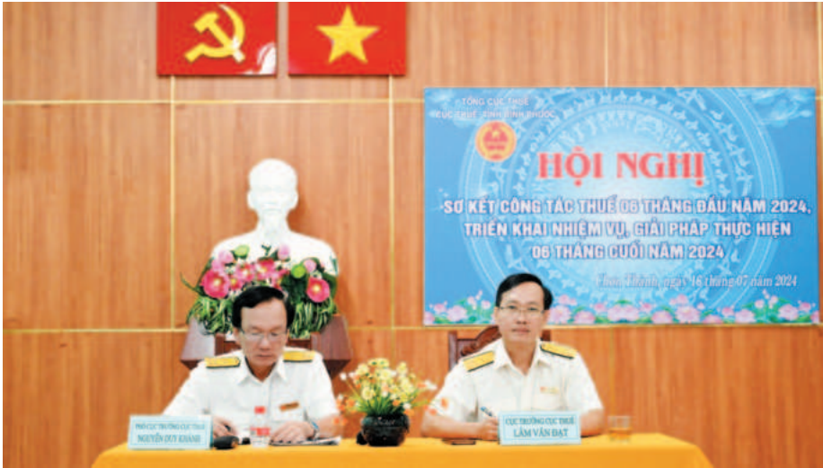
Lãnh đạo Cục Thuế tỉnh Bình Phước chủ trì hội nghị sơ kết công tác thuế 6 tháng đầu năm, triển khai nhiệm vụ, giải pháp 6 tháng cuối năm 2024

Từ đầu năm đến nay, Cục Thuế tỉnh Bình Phước đã triển khai đồng bộ, quyết liệt nhiều giải pháp nâng cao hiệu quả công tác thu, chống thất thu ngân sách, nhờ vậy, kết quả thu ngân sách trên địa bàn đạt được kết quả khá tích cực.