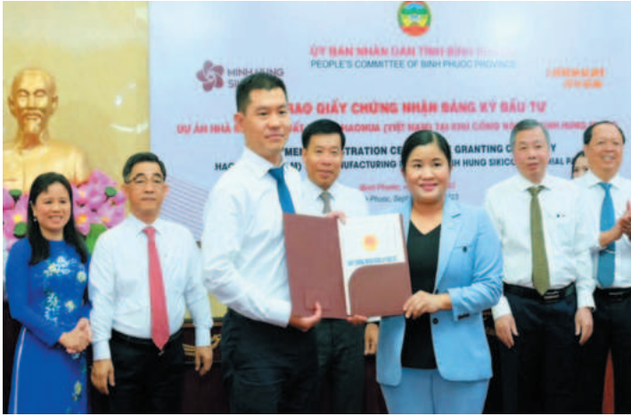
Chủ tịch UBND tỉnh Bình Phước Trần Tuệ Hiền trao Giấy chứng nhận đầu tư cho Chủ đầu tư dự án Nhà máy sản xuất lốp xe Haohua Việt Nam

Bình Phước nằm trong vùng kinh tế trọng điểm phía Nam, giáp các tỉnh Bình Dương, Đồng Nai là các tỉnh có nền công nghiệp phát triển mạnh; là cửa ngõ kết nối của vùng Đông Nam bộ với Tây Nguyên và nước bạn Campuchia. Với lợi thế về vị trí địa lý, điều kiện tự nhiên, cơ sở hạ tầng kinh tế và xã hội đồng bộ, quỹ đất dồi dào, cùng với chính sách thu hút đầu tư linh hoạt, Bình Phước đang là thời nam châm thu hút các nhà đầu tư.