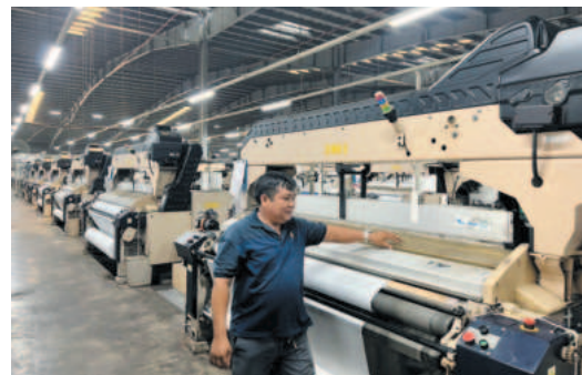
Công ty TNHH MTV Công nghiệp Future Tycoon hoạt động chính trong lĩnh vực may mặc

Mặc dù phải đối diện với nhiều khó khăn, thách thức do thị trường biến động, đơn hàng sụt giảm, song Công ty TNHH MTV Công nghiệp Future Tycoon, Khu công nghiệp Chơn Thành I, tỉnh Bình Phước vẫn nỗ lực duy trì việc làm, đảm bảo thu nhập ổn định cho nhiều lao động địa phương.