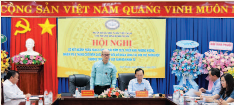
Phó Thống đốc Thường trực Ngân hàng Nhà nước - ông Đào Minh Tú làm việc với ngành ngân hàng Bình Phước

nhánh ngân hàng nước ngoài, ngân hàng thương mại (NHTM) 100% vốn nước ngoài và tổ chức tài chính vi mô.