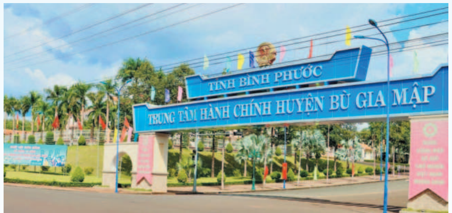
Trung tâm hành chính huyện Bù Gia Mập

Để thực hiện các mục tiêu trên, huyện Bù Gia Mập sẽ đẩy mạnh tuyên truyền, nâng cao nhận thức cho cán bộ, đảng viên, nhân dân thực hiện Nghị quyết Đại hội Đảng bộ huyện nhiệm kỳ 2020 - 2025 và chương trình mục tiêu quốc gia xây dựng NTM. Đồng thời, duy trì, nâng cao hoạt động cũng như mở rộng mô hình kinh tế tập thể; tập trung phát triển nhóm sản phẩm đặc trưng của huyện, hình thành chuỗi liên kết sản xuất và tiêu thụ sản phẩm nông nghiệp. Thành lập các cụm công nghiệp, mời gọi nhà đầu tư, xây dựng nhà máy, hình thành các cánh đồng mẫu lớn. Song song đó, tổ chức cho HTX, tổ hợp tác tham gia các gian hàng hội chợ quảng bá thương hiệu; nâng cao vai trò của cơ quan quản lý, vận động người dân tham gia các chuỗi liên kết. ■