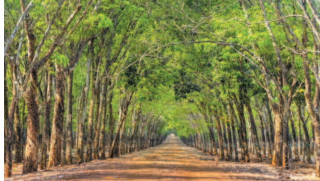
Binh Phuoc is known as the rubber capital of the country

Binh Phuoc is targeting investment across various sectors, including industry, trade and services, tourism, agriculture, health and education. The province is focusing on overcoming obstacles, prioritizing infrastructure development, administrative reform and human resource training. Specific programs and actions are being implemented to achieve breakthroughs and address key tasks and solutions effectively.