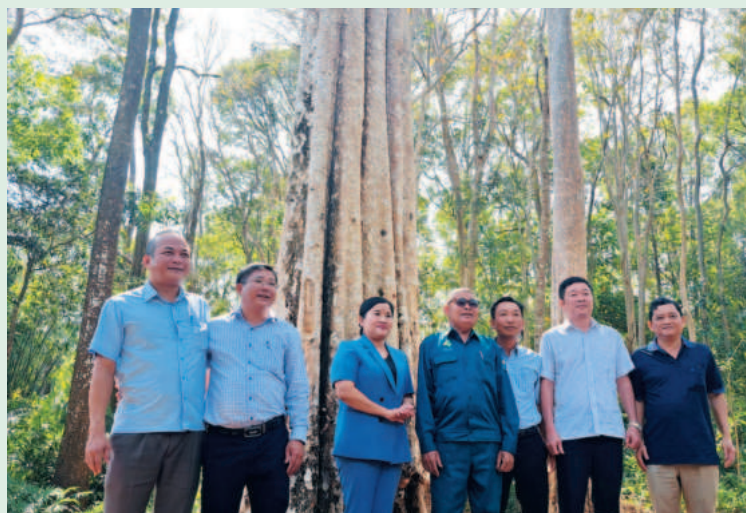
Chủ tịch UBND tỉnh Bình Phước - bà Trần Tuệ Hiền làm việc tại VQG Bù Gia Mập, tháng 01/2024

Một vài chia sẻ của ông về VQG Bù Gia Mập; nét đặc trưng, điểm nhấn nổi bật trong hệ thống VQG hiện hữu; ý nghĩa đối với sự phát triển của tỉnh và khu vực?