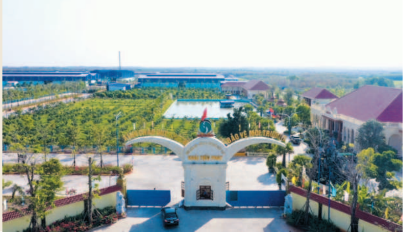
Khu liên hợp xử lý và tái chế chất thải Khải Tiến Phát

V iệt Nam đang là một trong những nước có mức tăng trưởng kinh tế hàng đầu châu Á, điểm đến của nhiều dự án sản xuất công nghiệp lớn. Tuy nhiên, cùng với sự phát triển kinh tế - xã hội và tốc độ đô thị hóa nhanh, các chuyên gia tính toán có hơn 2 triệu tấn rác/ngày phát thải ra môi trường.