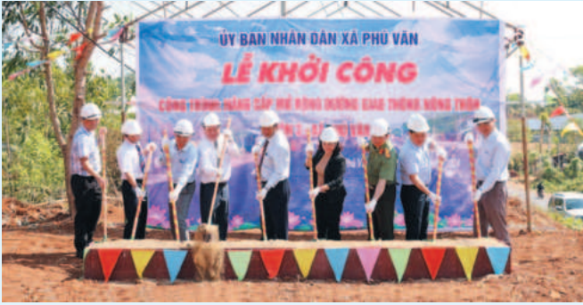
Khởi công công trình nâng cấp mở rộng đường giao thông nông thôn tại xã Phú Văn