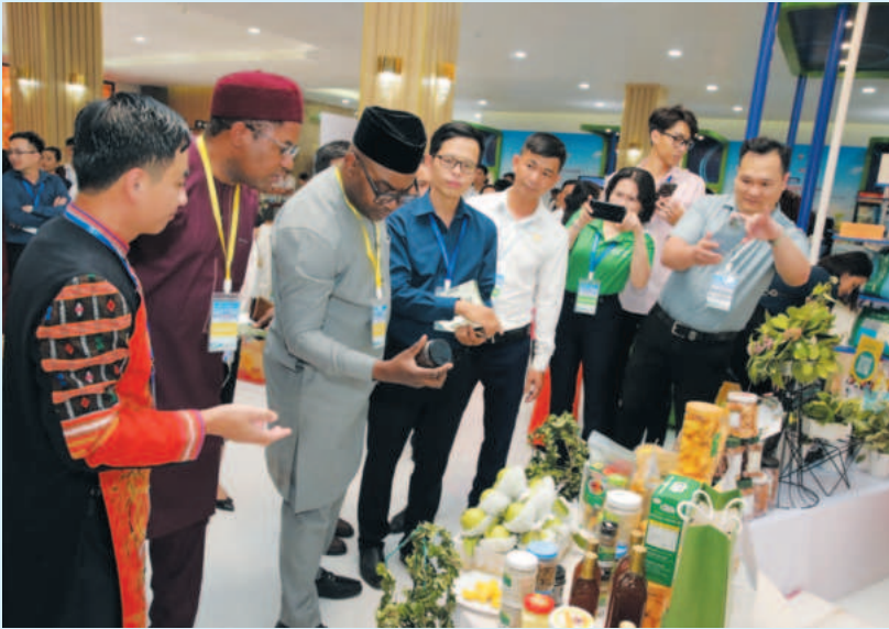
Delegates tour the exhibition area showcasing local businesses, industrial parks, and key products from Binh Phuoc province

Adhering to growth scenarios and planned targets of the industry and trade sector assigned by the Provincial People's Committee in 2024, the Department of Industry and Trade of Binh Phuoc province has effectively carried out solutions to complete its assigned targets and tasks with guaranteed quality and progress.