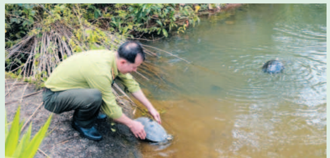
Tái thả động vật về rừng