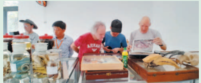
Đoàn nghiên cứu Bảo tàng Lịch sử Tự nhiên Erfurt, Cộng hòa Liên bang Đức khảo sát tại VQG Bù Gia Mập