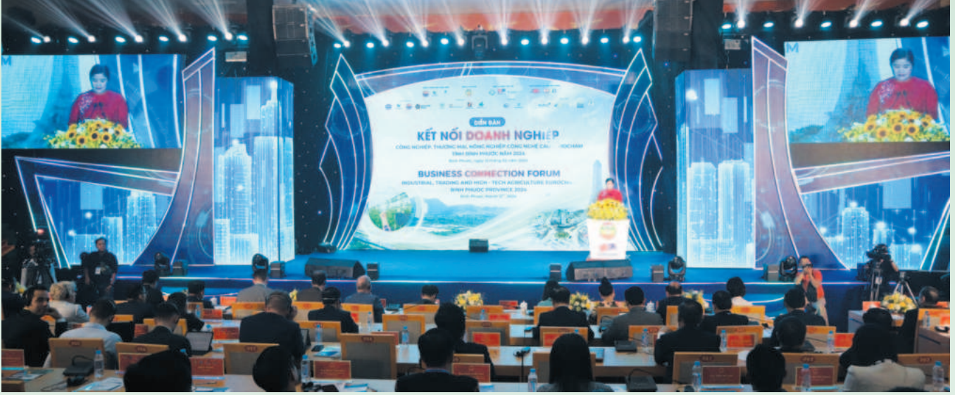
Diễn đàn kết nối doanh nghiệp nông nghiệp công nghệ cao EuroCham - tỉnh Bình Phước năm 2024 thu hút được các doanh nghiệp lớn trong nước và quốc tế tham gia như Nesdpice, De Heus, CP, Hùng Nhơn...

năm 2023, đã xuất khẩu hơn 1.682 tấn sản phẩm thịt gà chế biến sang Nhật, Hồng Kông (Trung Quốc), Lào, Campuchia với doanh thu ước đạt 144,5 triệu USD; Chuỗi sản xuất an toàn của Công ty Japfa đã dẫn hình thành các khâu trong chuỗi sản xuất: Nhà máy thức ăn - trại chăn nuôi - nhà máy giết mổ và chế biến thực phẩm; Chuỗi sản xuất thịt gà của Công ty De Heus với 07 trại (53 nhà) chăn nuôi gà với quy mô 1.060.000con/lứa đang hợp tác theo hình thức ký hợp đồng chăn nuôi bao tiêu đầu ra với giá ổn định. Các trang trại này đã được công nhận an toàn dịch bệnh và tham gia chuỗi an toàn thực phẩm của TP.Hồ Chí Minh.