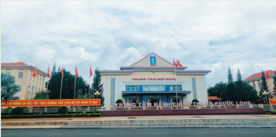
Trung tâm hành chính thị xã Phước Long

Thị xã Phước Long có vị trí chiến lược quan trọng cả về kinh tế, chính trị và an ninh quốc phòng; là trung tâm thương mại, dịch vụ, du lịch của các huyện, thị xã phía Bắc tỉnh Bình Phước. Thời gian qua, với sự vào cuộc của cả hệ thống chính trị từ cấp tỉnh đến huyện, cùng sự đồng lòng, quyết tâm cao độ của chính quyền và nhân dân, hệ thống hạ tầng trên địa bàn thị xã đã được nâng cấp, đầu tư xây dựng mới, đáp ứng yêu cầu phát triển kinh tế - xã hội và phục vụ tốt nhất đời sống nhân dân.