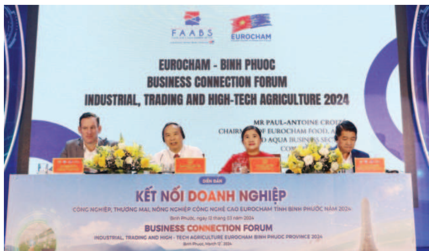
Business Connection Forum for Industry, Commerce, and High-Tech Agriculture EuroCham – Binh Phuoc Province 2024 provides a valuable platform for businesses to share, exchange, and gain experiences across these sectors