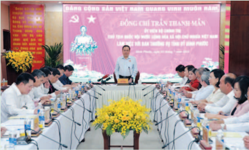
Chủ tịch Quốc hội Trần Thanh Mẫn làm việc với Ban Thường vụ Tỉnh ủy Bình Phước, ngày 3/7/2024

thoáng, minh bạch, thủ tục hành chính (TTHC) được rút ngắn tối đa. Đặc biệt, công cuộc chuyển đổi số gắn với CCHC đang là động lực quan trọng thúc đẩy phát triển kinh tế - xã hội theo hướng lãnh đạo, điều hành trên nền tảng số.