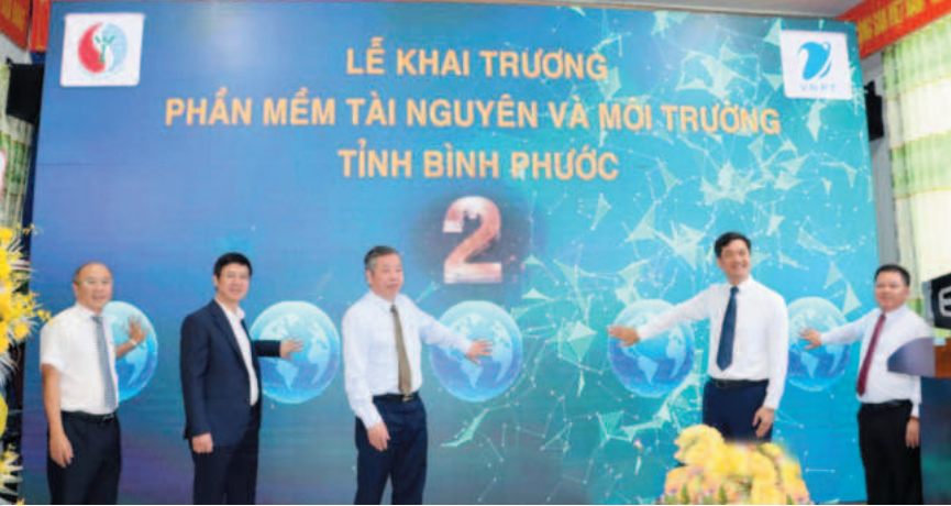
Các đại biểu thực hiện nghi thức khai trương "Phần mềm tài nguyên và môi trường tỉnh Bình Phước"