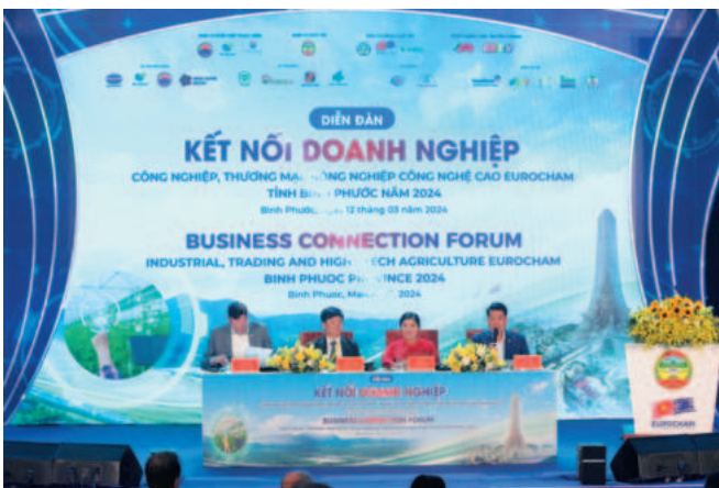
Diễn đàn kết nối doanh nghiệp công nghiệp, thương mại, nông nghiệp công nghệ cao EuroCham - tỉnh Bình Phước năm 2024

Năm 2024 là năm thứ tư thực hiện kế hoạch 5 năm phát triển kinh tế - xã hội (KT - XH) giai đoạn 2021 - 2025. Phấn đấu cao nhất để đạt được các mục tiêu đã đề ra trong bối cảnh nhiều khó khăn do ảnh hưởng từ đại dịch Covid-19 và biến động địa chính trị toàn cầu là nhiệm vụ nặng nề đặt ra cho ngành Công Thương. Do vậy, thời gian qua, Sở Công Thương tập trung rà soát, tổng hợp tình hình, số liệu, mức độ hoàn thành các chỉ tiêu của các lĩnh vực, từ đó bổ sung giải pháp thực hiện đảm bảo hiệu quả những tháng cuối năm, đề ra chỉ tiêu hợp lý cho năm 2025. Song song đó, kịp thời nắm tình hình, tháo gỡ khó khăn cho doanh nghiệp, địa phương; đổi mới, tăng cường hiệu quả công tác xúc tiến thương mại; có giải pháp đánh giá tỷ trọng của thương mại điện tử. Phối hợp các ngành liên quan có phương án phân bổ chỉ tiêu về công thương cho địa phương; đẩy mạnh tiến độ triển khai các khu, cụm công nghiệp, tích cực hỗ trợ các dự án sớm đưa vào hoạt động. Tích cực tham mưu UBND tỉnh giải quyết các khó khăn, vướng mắc, chủ động chuẩn bị các nội dung, số liệu phục vụ cho xây dựng kế hoạch phát triển KT - XH giai đoạn năm 2025 - 2030.