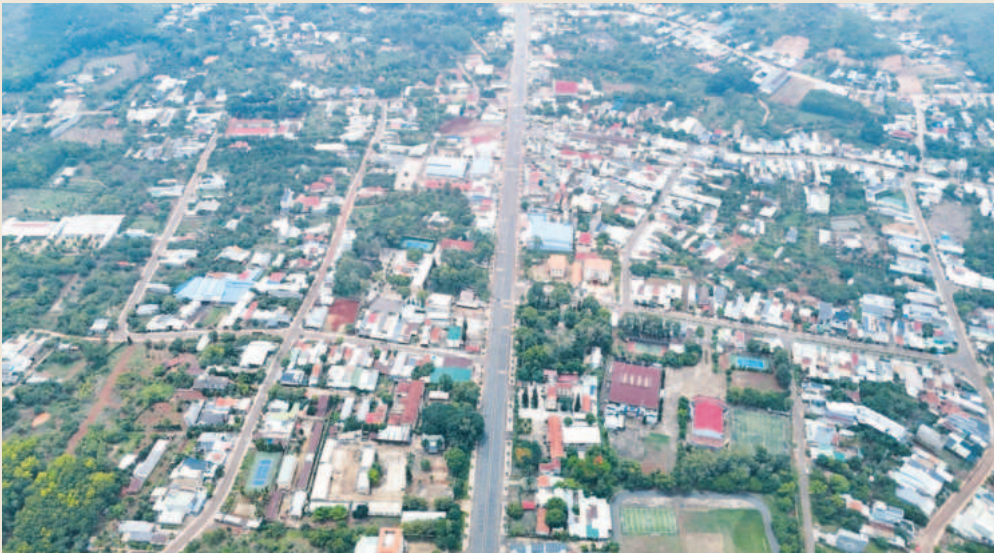
Trung tâm huyện Bu Đăng

Năm 2024 là năm có ý nghĩa quan trọng, năm tăng tốc tạo bứt phá để hoàn thành mục tiêu Nghị quyết Đại hội Đảng bộ nhiệm kỳ 2020 - 2025 và kế hoạch phát triển kinh tế - xã hội (KT - XH) 05 năm giai đoạn 2021 - 2025 của huyện Bu Đăng. Dưới sự lãnh đạo, chỉ đạo quyết liệt của Huyện ủy, sự giám sát chặt chẽ của HĐND huyện, sự điều hành tập trung, linh hoạt, hiệu quả của UBND huyện; sự ủng hộ, tham gia tích cực của nhân dân, cộng đồng doanh nghiệp đã tạo nên sức mạnh tổng hợp để huyện đạt những kết quả quan trọng trong phát triển KT - XH.