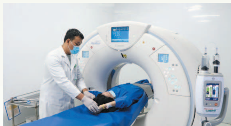
Hệ thống cơ sở khám, chữa bệnh được đầu tư máy móc hiện đại