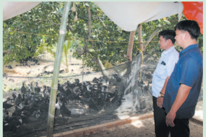
Lộc Ninh tích cực chuyển đổi cây trồng vật nuôi

Ninh quy hoạch 250ha để phát triển NNCNC. Toàn huyện có 27 sản phẩm OCOP hạng 3 - 4 sao.