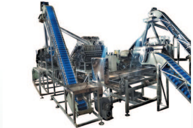
Hệ thống thiết bị tách vỏ cứng hạt điều của Đại Hoàng Kim Bình Phước đáp ứng đúng yêu cầu kỹ thuật, giúp đảm bảo hiệu suất và độ bền cao

để thương hiệu điều Bình Phước ngày càng phát triển bền vững, bên cạnh sự nỗ lực của doanh nghiệp, tỉnh Bình Phước cần tiếp tục có nhiều cơ chế, chính sách hỗ trợ, đồng hành cùng doanh nghiệp, trong đó có các doanh nghiệp ngành công nghiệp chế biến và phụ trợ chế biến hạt điều về phát triển vùng nguyên liệu; không gian quy hoạch sản xuất tập trung; chất lượng nguồn nhân lực; ứng dụng máy móc, thiết bị, đổi mới công nghệ sản xuất; xây dựng liên kết giữa doanh nghiệp và nông dân trong chuỗi sản xuất - chế biến - kinh doanh,...”. Bên cạnh đó, trong bối cảnh Việt Nam tích cực, chủ động tham gia các tổ chức kinh tế và các hiệp định thương mại, vị trí vai trò của các hiệp hội ngành nghề rất quan trọng. Vì vậy, tỉnh cần có định hướng, chỉ đạo sát sao nhằm nâng cao hiệu quả hoạt động của các hiệp hội ngành nghề trên địa bàn. “Qua đó, để các hiệp hội thể hiện rõ vai trò không chỉ là đại diện cho doanh nghiệp, nói tiếng nói chung của cộng đồng doanh nghiệp mà còn là một kênh hỗ trợ đắc lực cho sự phát triển của doanh nghiệp, cung cấp thông tin về thị trường, giá cả, tình hình tài chính,... trong và ngoài nước, cũng như công tác tư vấn, cầu nối xây dựng chuỗi liên kết sản xuất quy mô lớn, nâng cao sức cạnh tranh của các thành viên trên thị trường”, - ông Hoàng Kim Tiến bày tỏ kỳ vọng. ■