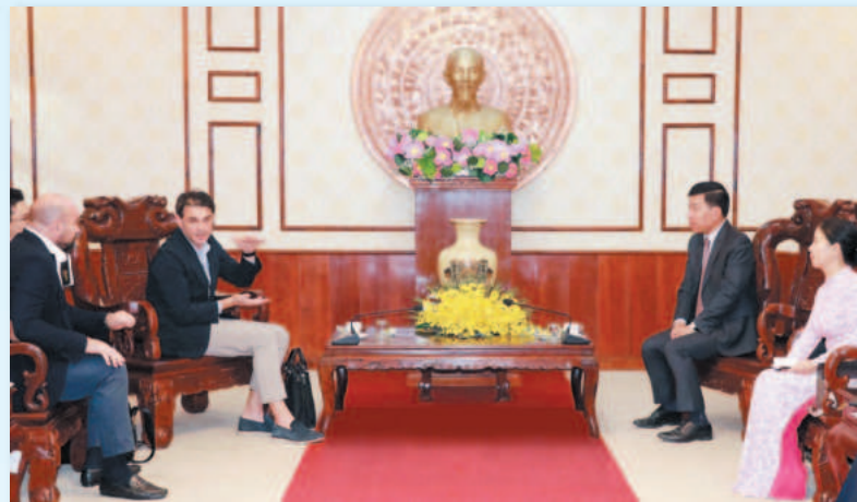
Prime Minister Pham Minh Chinh paid a working visit to the Hayat Kimya Vietnam factory, February 2022

decision-making process. Their commitment to creating a business-friendly environment has been evident in their policies and support mechanisms.