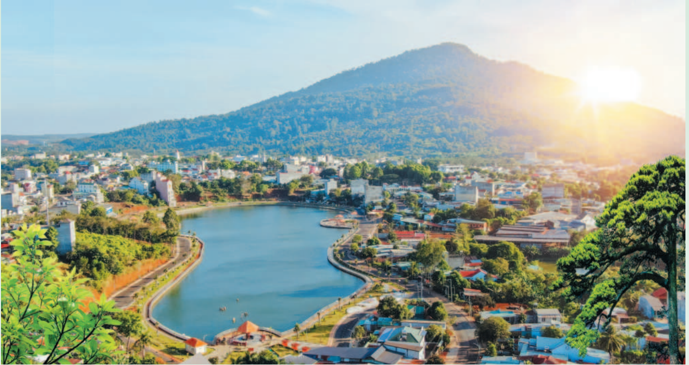
Hồ Long Thủy - Điểm nhấn đô thị Phước Long