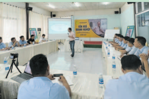
Công ty tổ chức nhiều chương trình đào tạo, hội thảo, tư vấn trực tiếp tại các cửa hàng cũng như lan tỏa văn hóa doanh nghiệp