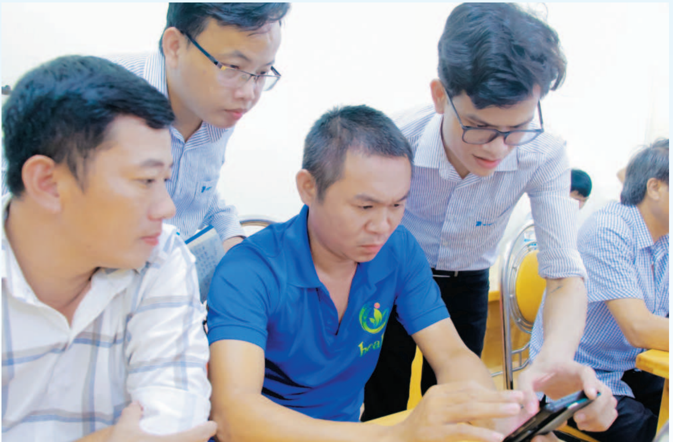
Hướng dẫn các hội viên hợp tác xã, các nông hộ cài đặt ứng dụng VNPT GREEN trên điện thoại thông minh

Với nền tảng về công nghệ, tiềm lực tài chính, nguồn nhân lực và kinh nghiệm triển khai các giải pháp CDS, trong thời gian tới, VNPT Bình Phước tiếp tục đầu tư và phát triển hạ tầng viễn thông hiện đại, đảm bảo kết nối mạng ổn định và chất lượng cao, đáp ứng nhu cầu ngày càng tăng của người dân và DN. Tích cực đồng hành cùng các đơn vị sở, ngành chuyên môn để triển khai đưa vào vận hành có hiệu quả các phần mềm và nền tảng CDS như Trung tâm Điều hành thông minh (IOC), cơ sở dữ liệu ngành Nông nghiệp, Giáo dục và các lĩnh vực khác hướng tới tạo ra các hệ sinh thái số liên kết chặt chẽ giữa các ngành, giúp quản lý và điều hành hiệu quả hơn. Ngoài ra, tham gia hỗ trợ đào tạo và nâng cao kỹ năng số cho cán bộ, nhân viên, đảm bảo có đủ khả năng khai thác, vận hành các hệ thống mới một cách hiệu quả. ■