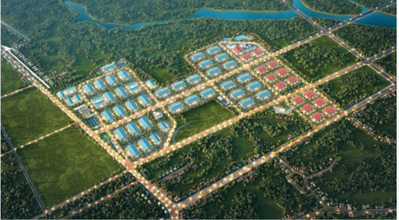
Perspective of Tan Phu and Tien Hung 1 industrial clusters