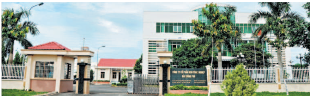
Công ty Cổ phần KCN Bắc Đồng Phú là chủ đầu tư của hai dự án KCN Bắc Đồng Phú và KCN Nam Đồng Phú tại tỉnh Bình Phước

Việc Thủ tướng Chính phủ ban hành Quyết định số 227/QĐ-TTg điều chỉnh một số chỉ tiêu sử dụng đất đến năm 2025 đã mở ra triển vọng tích cực trong việc mở rộng Khu công nghiệp (KCN) Bắc Đồng Phú và Nam Đồng Phú. Các dự án mở rộng được Chính phủ, các bộ, ngành, chính quyền địa phương ủng hộ sẽ góp phần đưa Bình Phước trở thành điểm sáng trong phát triển kinh tế - xã hội và thu hút đầu tư. Đồng thời, với kinh nghiệm tích lũy, sự chuẩn bị kỹ lưỡng và quyết tâm cao của Công ty, việc triển khai dự án sẽ đúng kế hoạch đề ra.