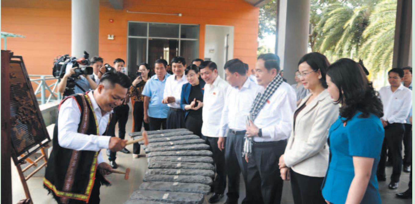
Chủ tịch Quốc hội Trần Thanh Mẫn và đoàn công tác của Ủy ban Thường vụ Quốc hội thăm Khu di tích quốc gia đặc biệt Bộ Chỉ huy miền Tà Thiết - Lộc Ninh, tháng 7/2024

Từ vùng đất bị chiến tranh tàn phá nặng nề, phát huy truyền thống cách mạng anh dũng, kiên cường, Lộc Ninh hôm nay đã ngày càng “thay da đổi thịt”, kinh tế phát triển, đời sống người dân không ngừng được nâng cao. Thời gian tới, huyện tiếp tục đẩy mạnh tuyên truyền, triển khai thực hiện 03 chương trình đột phá về nông nghiệp công nghệ cao (NNCNC), phát triển kinh tế cửa khẩu Hoa Lư và du lịch nhằm lan tỏa quyết tâm, khát vọng, tạo sự đồng thuận, thu hút nguồn lực đưa Lộc Ninh bứt phá.