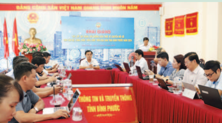
Department of Information and Communications consistently conducts training sessions on digital transformation for officials, civil servants, and public employees in the province

☞ procedures and providing public services - ranked 3rd out of 63 provinces and cities.