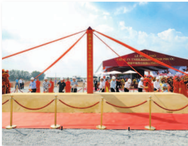
Tập đoàn Keeson khởi công xây dựng nhà máy tại Cụm công nghiệp Tân Tiến 1

Cụm công nghiệp Thành Phương là một trong những cụm công nghiệp nổi bật của Bình Phước bao gồm 4 cụm công nghiệp: Tân Tiến 1, Tân Tiến 2, Tân Phú, Tiến Hưng 1 có lợi thế về hạ tầng giao thông thuận lợi, địa hình tự nhiên tương đối bằng phẳng. Đây là một cụm công nghiệp sinh thái toàn diện, dự án được quy hoạch sát sao, chặt chẽ, đảm bảo tính ứng dụng, kết hợp công nghệ cao thúc đẩy phát triển bền vững, sở hữu nhà máy xử lý nước thải đạt tiêu chuẩn theo quy định trước khi thải ra môi trường.