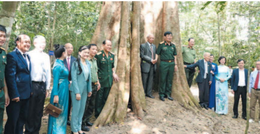
Các đại biểu dự Lễ công nhận quần thể 162 cây di sản Việt Nam tại khu rừng Mã Đà, tháng 12/2023

Cùng với việc ra mắt ứng dụng trên app zalo hướng dẫn người dân thực hiện TTHC về đất đai, được đặt tại Bộ phận một cửa cấp tỉnh và cấp huyện, Sở đã thành lập Tổ hướng dẫn TTHC tại các chi nhánh, hướng dẫn người dân thực hiện kê khai các loại giấy tờ liên quan đến việc cấp Giấy chứng nhận quyền sử dụng đất, hoàn thiện thành phần hồ sơ theo quy định và đặc biệt là hướng dẫn người dân thao tác, trình tự trong nộp hồ sơ trực tuyến và thanh toán nghĩa vụ tài chính trên Cổng dịch vụ công; hỗ trợ người cao tuổi (trên 80 tuổi), người tàn tật, dân tộc thiểu số trong việc lập hồ sơ.