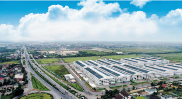
Khu công nghiệp Becamex Bình Phước tại huyện Chơn Thành, tỉnh Bình Phước

Việc phát triển các khu công nghiệp (KCN) sinh thái, KCN xanh không chỉ là xu hướng chung mà còn góp phần quan trọng trong hiện thực hóa các cam kết hướng tới mục tiêu phát thải ròng bằng “0” (NetZero) vào năm 2050, Chiến lược quốc gia về tăng trưởng xanh giai đoạn 2021 - 2030, tầm nhìn 2050 và nhiều chính sách quan trọng khác của Việt Nam.