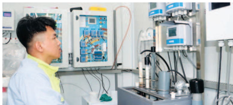
Cán bộ Sở Tài nguyên và Môi trường tỉnh Bình Phước kiểm tra hệ thống quan trắc nước mặt trên địa bàn huyện Đồng Phú