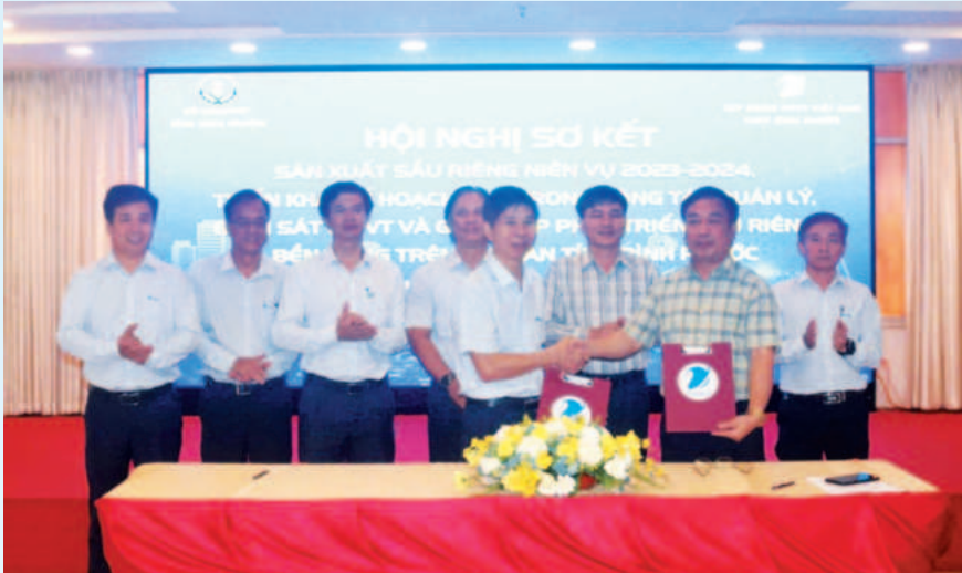
VNPT Bình Phước và Chi cục Trồng trọt và Bảo vệ thực vật tỉnh Bình Phước ký kết chương trình phối hợp triển khai kế hoạch CDS trong công tác quản lý, giám sát mã số vùng trồng và phát triển sản phẩm riêng bền vững trên địa bàn tỉnh

5G. Với sự chỉ đạo và hỗ trợ từ Tập đoàn VNPT, cùng với nỗ lực đầu tư và nâng cấp hạ tầng, VNPT Bình Phước cam kết mang đến những dịch vụ viễn thông tiên tiến, đáp ứng nhu cầu của người dân và góp phần thúc đẩy sự phát triển bền vững của tỉnh.