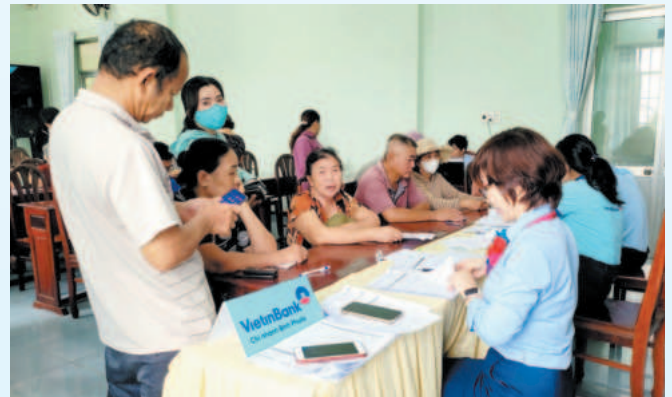
Cán bộ nhân viên VietinBank Bình Phước mở tài khoản an sinh xã hội tại địa bàn tỉnh

Với các hành động thiết thực, cụ thể dành cho xã hội, cộng đồng, VietinBank Bình Phước tự hào là một phần của sự phát triển bền vững, không chỉ trong lĩnh vực tài chính mà còn trong việc xây dựng và nâng cao đời sống người dân trên địa bàn tỉnh. ■