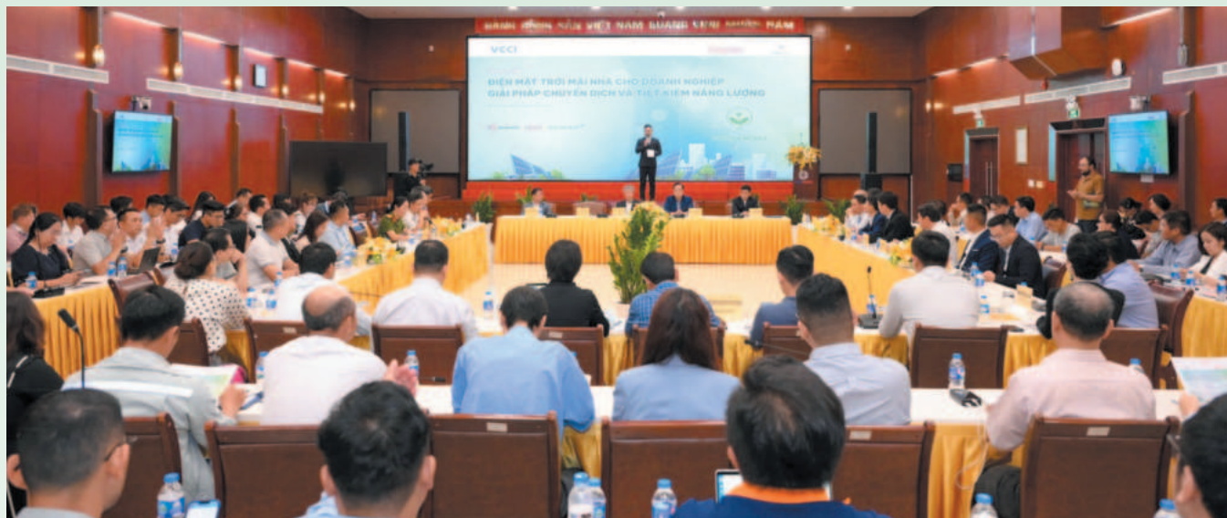
Diễn đàn "Điện mặt trời mái nhà cho doanh nghiệp: Giải pháp chuyển dịch và tiết kiệm năng lượng" do VCCI chi nhánh TP.Hồ Chí Minh tổ chức