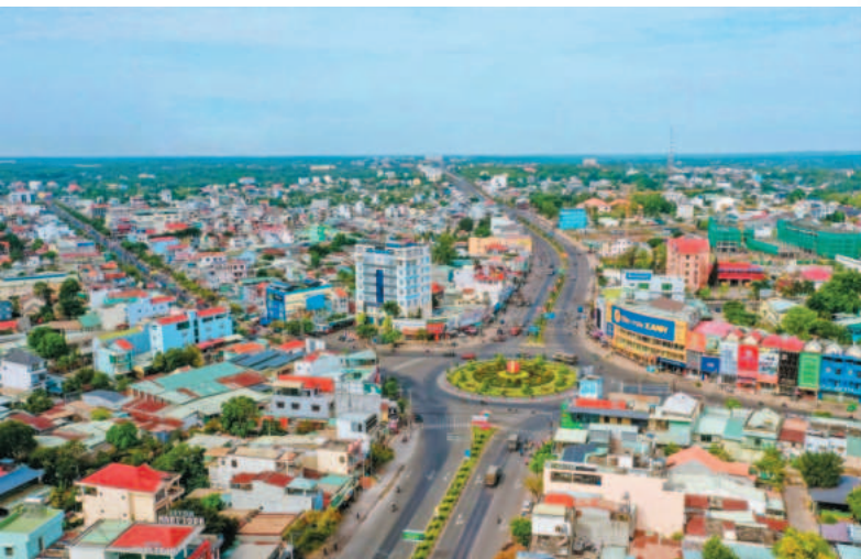
Một góc TP.Đồng Xoài, tỉnh Bình Phước