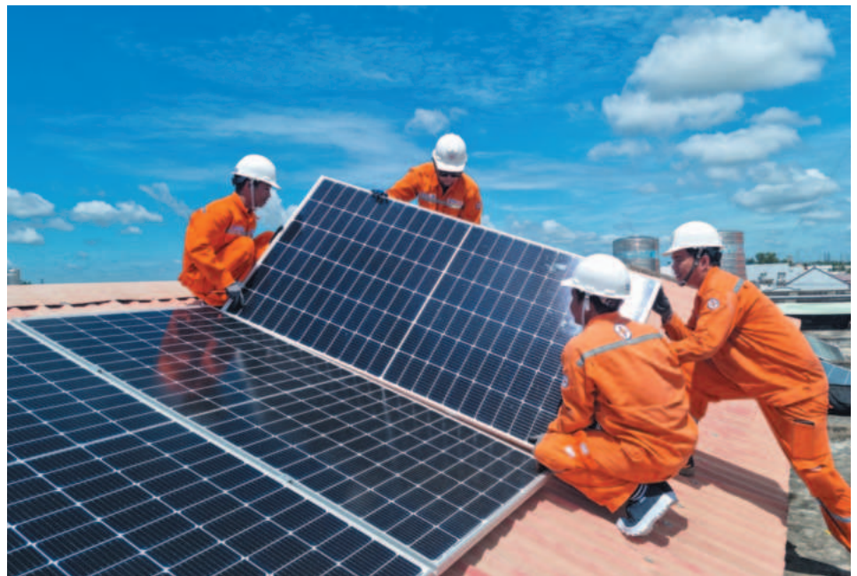
Utilizing rooftop solar power not only enables businesses to reduce costs and generate electricity for production but also enhances their competitive edge in export markets

In addition to financial concerns, the Ministry of Industry and Trade's cap on the grid-connected rooftop solar power capacity of 2,600 MW according to Power Plan 8 also makes businesses worried about the limit imposed on their installed capacity. Hence, they also proposed that the Government consider expanding the installed capacity of solar power in the plan or removing the quota allocated to provinces and cities so as to encourage and attract economic sectors and people to invest in installing rooftop solar power for manufacturing and business and help ensure national energy security. ■