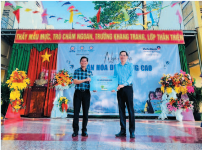
Đại diện Ban Lãnh đạo VietinBank Bình Phước trao tặng Tủ sách tinh hoa tại chương trình Lan tỏa văn hóa đọc - Trường Nguyễn Trường Tộ, huyện Bù Đăng, tỉnh Bình Phước

Với 5 giá trị cốt lõi của văn hóa doanh nghiệp, đặc biệt là sự thấu cảm và khả năng thích ứng, VietinBank Bình Phước đã thường xuyên tổ chức và tham gia nhiều hoạt động an sinh xã hội, lan tỏa những giá trị tốt đẹp đến cộng đồng.