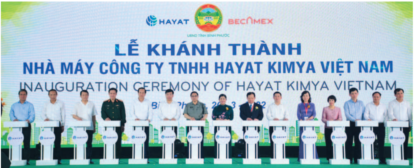
Thủ tướng Phạm Minh Chính và lãnh đạo các bộ, ngành, địa phương thực hiện nghi thức khánh thành Nhà máy Hayat Kimya Việt Nam, tháng 02/2022

môi trường thân thiện với doanh nghiệp đã được thể hiện rõ trong các chính sách và cơ chế hỗ trợ của tỉnh.