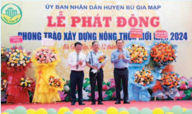
Huyện Bù Gia Mập phát động phong trào xây dựng nông thôn mới năm 2024

Với tinh thần đoàn kết cùng ý chí tự lực, tự cường, nắm bắt thời cơ thuận lợi, ra sức thi đua lao động sản xuất, huyện Bù Gia Mập đã gạt hái những thành tựu nổi bật trên hành trình đổi mới và hội nhập. Phấn đấu xây dựng huyện phát triển ổn định, bền vững với phương châm “Đoàn kết - Dân chủ - Kỷ cương - Phát triển”, Đảng bộ, chính quyền, nhân dân huyện quyết tâm thực hiện thắng lợi Nghị quyết Đại hội Đảng bộ huyện khóa XII và Nghị quyết của cấp ủy cấp trên đề ra.