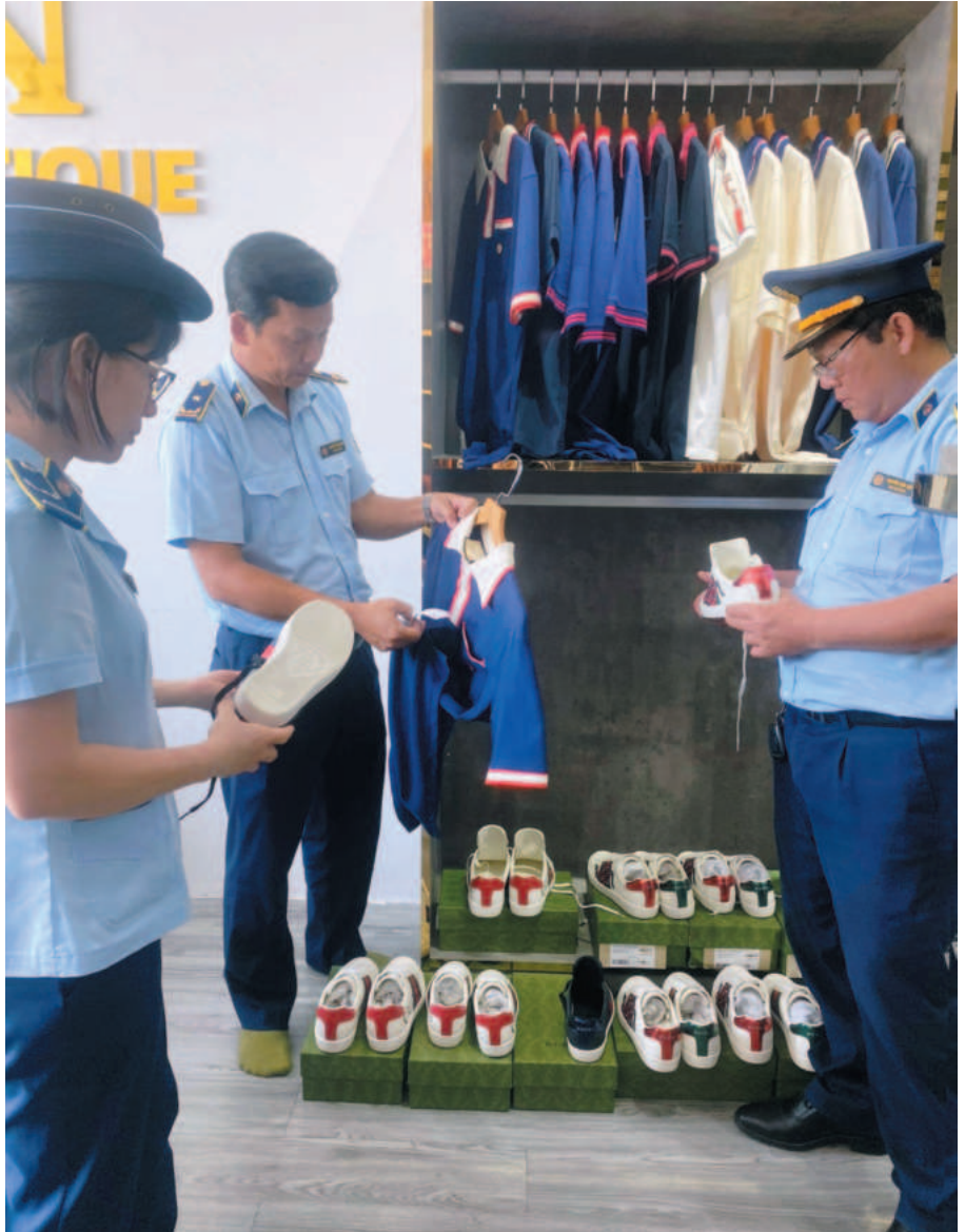
Kiểm tra chất lượng hàng hóa, bảo vệ quyền lợi chính đáng của người tiêu dùng

Với các doanh nghiệp trên địa bàn, Cục đã ký kết Quy chế phối hợp với Chi nhánh xăng dầu Bình Phước - Công ty xăng dầu Sông Bé TNHH MTV; phối hợp tốt với các doanh nghiệp đại diện sở hữu công nghiệp theo ủy quyền