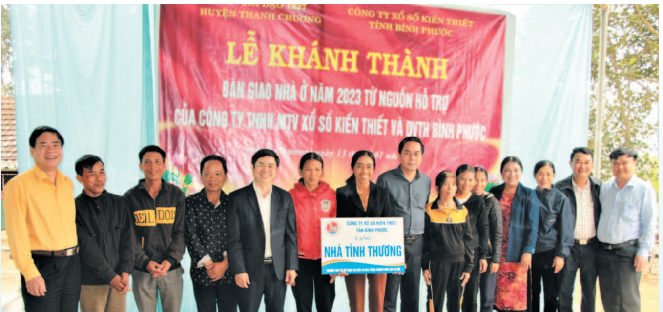
XSKT Bình Phước tích cực thực hiện các hoạt động vì cộng đồng như xây dựng nhà đại đoàn kết, nhà tình thương, tặng quà cho người nghèo,...