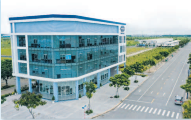
Khu công nghiệp và Dân cư Becamex - Bình Phước nằm trong vùng kinh tế trọng điểm phía Nam của tỉnh Bình Phước

Địa chỉ: Lô TDC33, đường D3B, KDC ấp 4B, phường Minh Thành, thị xã Chơn Thành, tỉnh Bình Phước. Điện thoại: (02713) 640 079 / Fax: (02713) 640 080 / Website: www.becamexbinhphuoc.com.vn