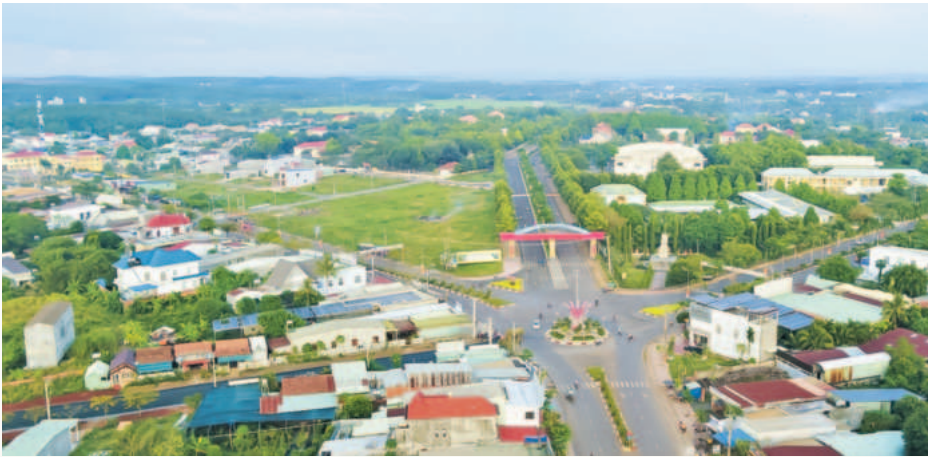
Diện mạo đô thị huyện Bù Đốp ngày càng đồng bộ, khang trang và hiện đại

sử; tập trung huy động nguồn lực đầu tư kết cấu hạ tầng đồng bộ; nâng cấp, mở rộng các tuyến đường để đảm bảo kết nối thông suốt các địa điểm du lịch, di tích lịch sử; xây dựng hệ thống nhà hàng, khách sạn nghỉ dưỡng. Xây dựng sản phẩm du lịch cộng đồng gắn với phát triển nông thôn mới và chương trình OCOP; đẩy mạnh xúc tiến quảng bá du lịch cộng đồng và sản phẩm OCOP, sản phẩm làng nghề, lễ hội văn hóa của các dân tộc bản địa để tạo điểm nhấn thu hút du khách.