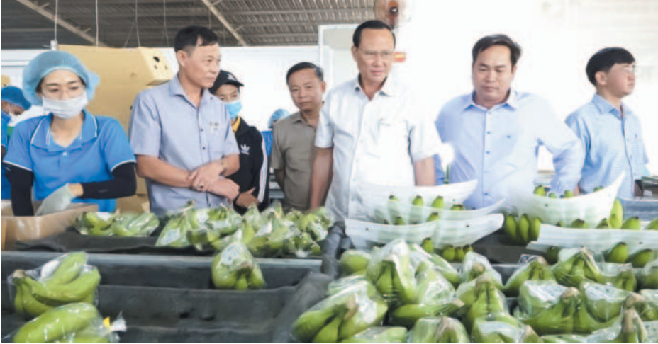
Lãnh đạo huyện Bù Đốp thăm, khảo sát thực tế Dự án “Sản xuất, chế biến và kinh doanh sản phẩm từ chuối” tại xã Thiện Hưng