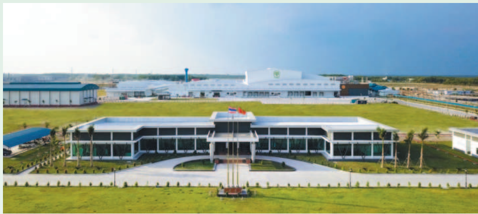
Nhà máy chế biến gà xuất khẩu CPV FOOD có số vốn đầu tư 250 triệu USD, công suất thiết kế lên đến 100 triệu con/năm được đặt tại KCN Becamex Bình Phước

Hiện nay, Sở đang tích cực hướng dẫn các địa phương tiêu chí để hình thành vùng sản xuất NNCNC, dự kiến năm 2025 sẽ hình thành 01 vùng NNCNC, 01 khu NNCNC. Duy