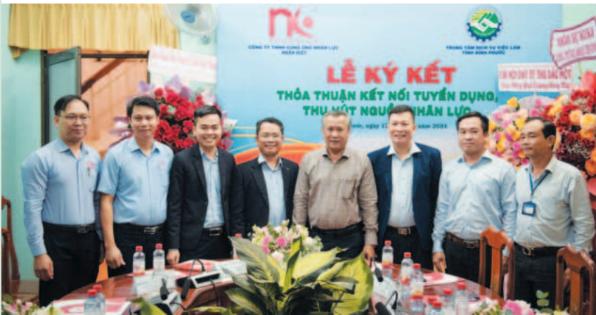
Trung tâm DVVL hợp tác với doanh nghiệp trong việc cung ứng nhân lực

Với việc triển khai nhiều giải pháp kết nối cung - cầu lao động, Trung tâm Dịch vụ việc làm (DVVL) Bình Phước đã tạo thuận lợi nhất để doanh nghiệp ổn định sản xuất, kinh doanh và giúp người lao động (NLĐ) tìm được việc làm phù hợp, ổn định cuộc sống.