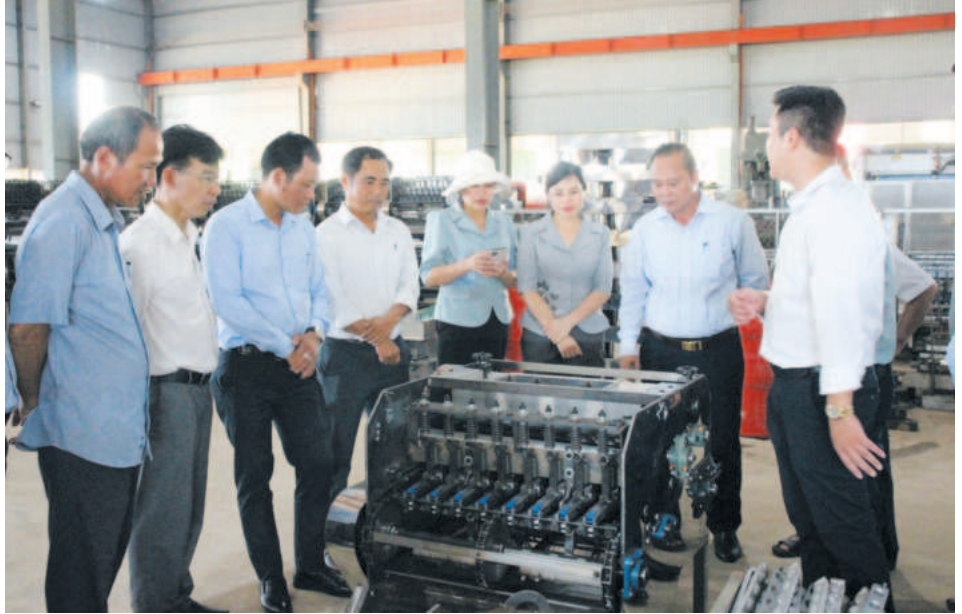
Lãnh đạo tỉnh Bình Phước, huyện Phú Riềng, xã Bình Tân và các xã tham quan Công ty Cổ phần Đại Hoàng Kim Bình Phước