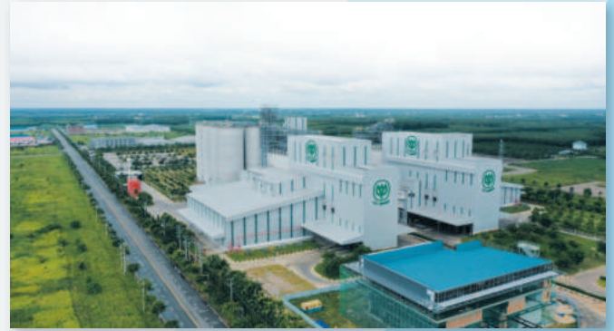
Khu công nghiệp Becamex - Bình Phước có một vị trí địa lý kinh tế thuận lợi