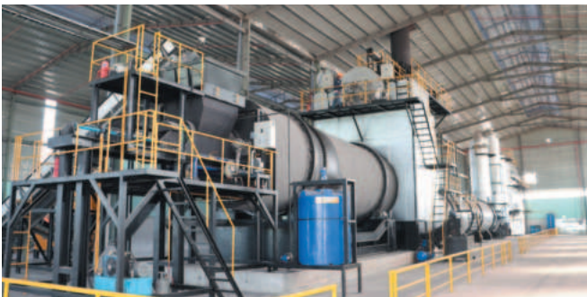
Hệ thống máy móc được đầu tư công nghệ tiên tiến, hiện đại bậc nhất hiện nay

Theo lãnh đạo Công ty cho biết: Việc đưa vào hoạt động Dự án Khu liên hợp xử lý và tái chế chất thải tại tỉnh Bình Phước sẽ tạo tiền đề để Khải Tiến Phát liên kết, hợp tác đầu tư và triển khai thêm nhiều dự án về xử lý rác thải tại các tỉnh, thành phố nhằm góp phần xây dựng “Việt Nam Xanh”. ■