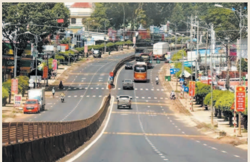
Quốc lộ 14, xuyên qua trung tâm hành chính huyện Bù Đẳng

tình hình thế giới và khu vực tiếp tục biến động phức tạp, hậu quả của đại dịch Covid-19 còn phải khắc phục lâu dài. Quốc hội, Chính phủ tiếp tục có nhiều chính sách miễn, giảm, gia hạn thuế, phí,... nhằm phục hồi kinh tế và tháo gỡ khó khăn cho người dân và doanh nghiệp. Để thực hiện thắng lợi nhiệm vụ được giao năm 2024, UBND huyện Bộ Đảng đã đề ra mục tiêu trong năm 2024 là phấn đấu hoàn thành, vượt 23 chỉ tiêu phát triển KT - XH, quốc phòng an ninh. Đây là nhiệm vụ của cả hệ thống chính trị, UBND huyện đã yêu cầu các cấp, các ngành chủ động, tích cực triển khai thực hiện có hiệu quả các chỉ tiêu Nghị quyết của Huyện ủy, HĐND huyện giao và các chương trình, kế hoạch công tác với nhiều giải pháp đột phá, phù hợp với tình hình thực tiễn của địa phương, sớm hoàn thành các chỉ tiêu, nhiệm vụ đã đề ra". ■