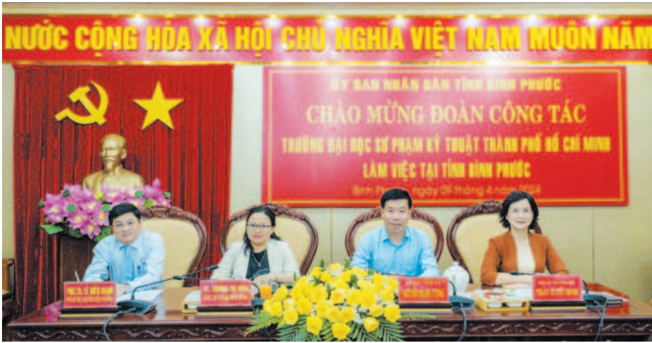
Trường Đại học Sư phạm Kỹ thuật TP.Hồ Chí Minh (HCMUTE) làm việc với UBND tỉnh Bình Phước về thành lập Phân hiệu Trường Đại học Sư phạm Kỹ thuật TP.Hồ Chí Minh tại tỉnh Bình Phước

doanh nghiệp, nhu cầu chuyển đổi cơ cấu, chuyển dịch lao động khu vực nông thôn và nông dân (với giải pháp Tăng cường điều tra, khảo sát, hỗ trợ các cơ sở GDNN mở mới các mã ngành, cải tiến, phát triển chương trình đào tạo theo hình thức vừa làm vừa học,...)