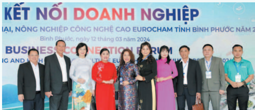
Diễn đàn kết nối doanh nghiệp công nghiệp, thương mại, nông nghiệp công nghệ cao EuroCham - tỉnh Bình Phước năm 2024

Về tổng thể, kết quả thực hiện các nhiệm vụ thu hút đầu tư, khai thác phát triển các ngành nghề, lĩnh vực chưa đạt kỳ vọng so với tiềm năng, lợi thế của tỉnh. Nhưng với vị trí nằm trong vùng kinh tế trọng điểm phía Nam; Tỉnh ủy, UBND tỉnh đã xác định tầm nhìn chiến lược và đề ra nhiều quyết sách, định hướng phát triển; chương trình hành động và quan tâm lãnh đạo, chỉ đạo sâu sát, tập trung mọi nguồn lực đầu tư phát triển hệ thống kết cấu hạ tầng; cải thiện môi trường; giải quyết khó khăn, vướng mắc hỗ trợ nhà đầu tư, kinh doanh; đồng thời đẩy mạnh công tác xúc tiến đầu tư theo hướng trọng tâm, trọng điểm, đa dạng, hiệu quả nên thu hút sự quan tâm tìm hiểu của các đối tác dẫn đến xu hướng, triển vọng đầu tư vào Bình Phước ngày càng gia tăng.