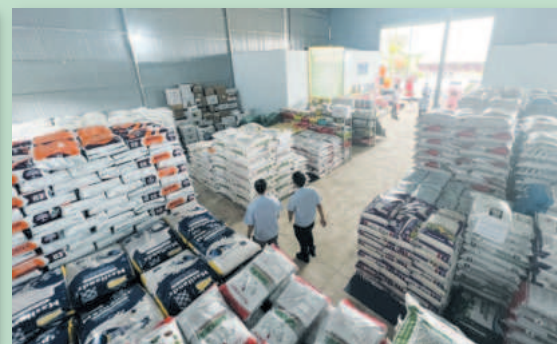
Công ty cung cấp đa dạng các loại vật tư nông nghiệp