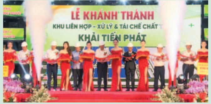
Khu liên hợp xử lý và tái chế chất thải tại KKT của khẩu Hoa Lư - Lộc Ninh

trở thành một trong những huyện có tốc độ phát triển khá cao trong tỉnh. Cơ cấu kinh tế chuyển dịch theo hướng tăng nhanh tỷ trọng công nghiệp và thương mại, dịch vụ. Tốc độ tăng trưởng kinh tế trung bình hàng năm đạt trên 13%.