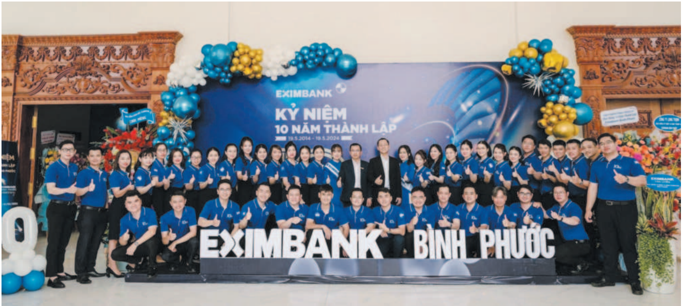
Eximbank Bình Phước tự hào một thập kỷ luôn đồng hành phát triển cùng kinh tế - xã hội địa phương

Một thập kỷ xây dựng và phát triển, Eximbank Bình Phước đã không ngừng lớn mạnh, ngày càng khẳng định thương hiệu và vị thế trong hệ thống Eximbank cũng như trên địa bàn tỉnh, nhận được sự tin yêu từ các quý khách hàng. Trong suốt quá trình hoạt động, Chi nhánh luôn bám sát mục tiêu an toàn, bền vững, hiệu quả; đảm bảo tuân thủ đầy đủ các quy định của pháp luật, Ngân hàng nhà nước (NHNN) cũng như quy trình nội bộ của Eximbank.