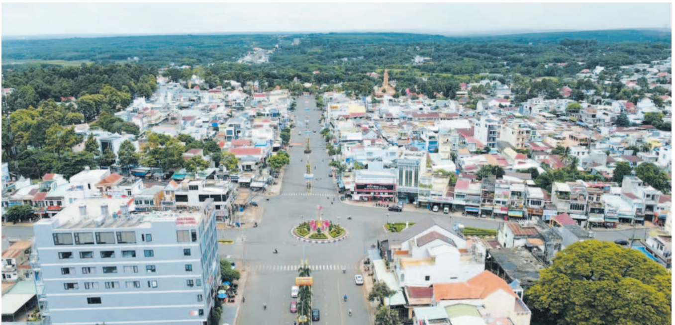
Thị xã Bình Long đang chuyển mình thành một đô thị trẻ năng động với kết cấu hạ tầng đồng bộ

Cụ thể, tốc độ tăng trưởng giá trị sản xuất: 13% (KH: 12,95%). Tổng giá trị sản xuất theo giá cố định: 6.118,65 tỷ đồng, đạt 51,07% so với KH, bằng 111,40% so với cùng kỳ. Tổng giá trị sản xuất theo giá hiện hành: 8.396,33 tỷ đồng, đạt 50,87% so với KH, bằng 111,40% so với cùng kỳ. Giá trị sản xuất nông, lâm, thủy sản ước thực hiện 6 tháng đầu năm 2024 là 669,43 tỷ đồng, đạt 51,49% so với KH, bằng 110,53% so với cùng kỳ. Giá trị sản xuất công nghiệp,