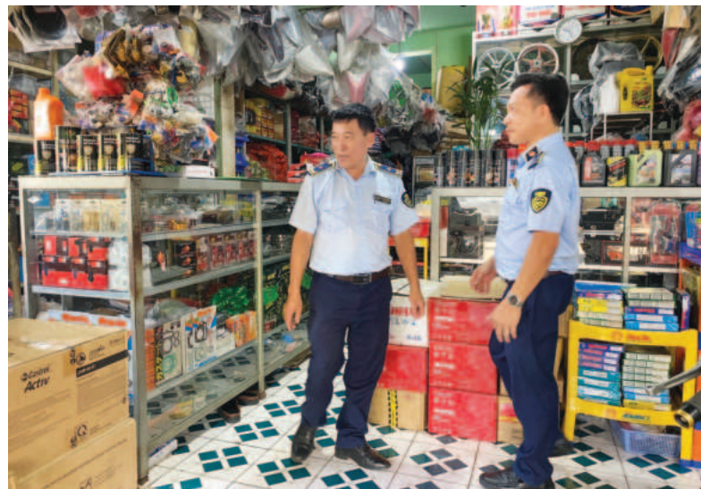
Cục QLTT tỉnh Bình Phước luôn nỗ lực, quyết liệt trong công tác kiểm tra, kiểm soát thị trường

Song song với đó, Cục cũng xây dựng đội ngũ công chức có bản lĩnh, năng lực chuyên môn, hoạt động hiệu quả; chú trọng nâng cao chất lượng công tác tuyên truyền, phổ biến giáo dục pháp luật, góp phần nâng cao nhận thức, ý thức chấp hành pháp luật cho người dân và doanh nghiệp để hạn chế sai phạm. Trong thực thi công vụ, không gây tác động xấu trộn