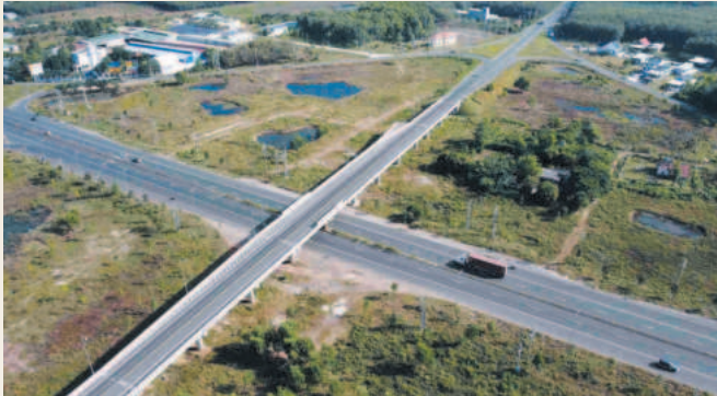
Đoạn đường Quốc lộ 14 giao nhau với Quốc lộ 13 tại thị xã Chơn Thành

Nhằm hoàn thành thắng lợi khâu đột phá về phát triển hạ tầng tại Nghị quyết Đại hội đại biểu Đảng bộ tỉnh lần thứ XI, Bình Phước đã triển khai đồng bộ các giải pháp, trọng tâm là tăng cường kết nối các khu kinh tế động lực của tỉnh, thúc đẩy liên kết vùng, góp phần nâng cao năng lực cạnh tranh, thu hút đầu tư.