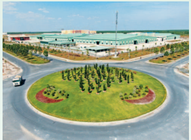
KCN Minh Hưng - Sikico trở thành điểm sáng về thu hút đầu tư trên địa bàn Hớn Quản