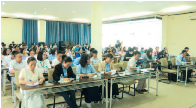
Sở Tư pháp Bình Phước thường xuyên tổ chức các hội nghị tuyên truyền, phổ biến pháp luật về lao động

Hoạt động hỗ trợ pháp lý (HTPL) cho doanh nghiệp nói chung, đặc biệt là doanh nghiệp nhỏ và vừa nói riêng đã được tỉnh Bình Phước quan tâm triển khai với nhiều nội dung, chính sách cụ thể. Thông qua đó, giúp doanh nghiệp nâng cao nhận thức, ý thức chấp hành pháp luật; đồng thời, nắm bắt và tháo gỡ kịp thời các khó khăn, vướng mắc trong hoạt động kinh doanh, tạo điều kiện cho doanh nghiệp phát triển bền vững.