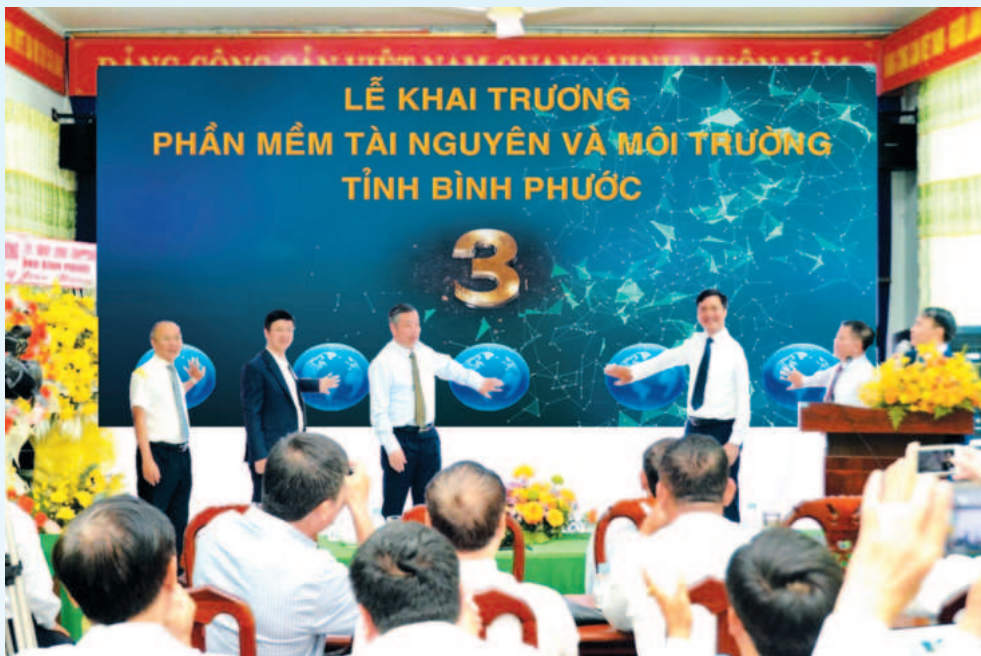
Lễ khai trương phần mềm Tài nguyên và Môi trường tỉnh Bình Phước

Thời gian qua, bám sát các nhiệm vụ chính trị của tỉnh, kế hoạch của ngành Thông tin và Truyền thông trong công tác chuyển đổi số (CĐS), VNPT Bình Phước đã nỗ lực xây dựng lộ trình, giải pháp cụ thể với những nội dung cốt lõi, có trọng tâm, trọng điểm. Qua đó, khẳng định vai trò tiên phong, dẫn dắt, đồng hành của doanh nghiệp (DN) viễn thông với địa phương trong công cuộc CĐS, hướng tới xây dựng chính quyền số, kinh tế số, xã hội số.